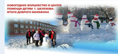
НОВОГОДНЕЕ ВОЛШЕВСТВО В ЦЕНТРЕ ПОМОЩИ ДЕТЯМ г. ШЕЛЕХОВА: ИТОГИ ДОБРОГО МАРАФОНА

В сотрудничестве с НКО, БФ и другими организациями специалисты отделения активно взаимодействуют с волонтерами. Заключены соглашения о сотрудничестве на декабрь 2025 года.