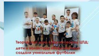
Творческая группа в МБОУ «СОШ №1» г. Шелехова ЦПА: дети и волонтеры «Мир добра» создали уникальные футболки